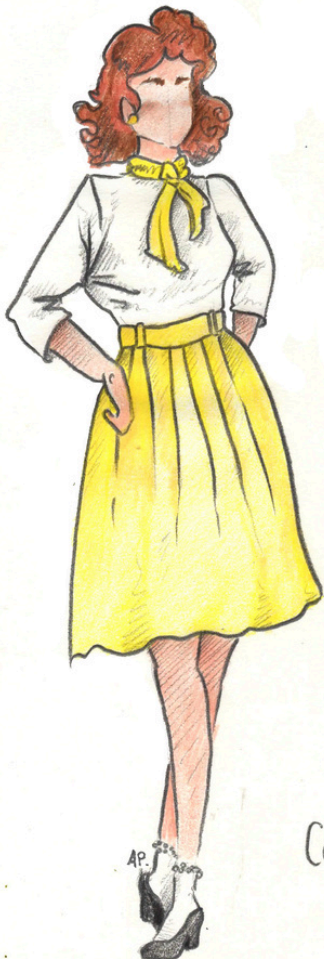
CÉLIMÈNE par Lisa