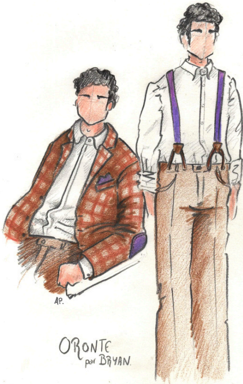
ORONTE par BRYAN