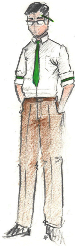
ALCESTE par Arthur.