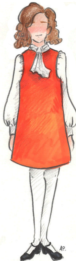
ELIANTE par BERTILLE