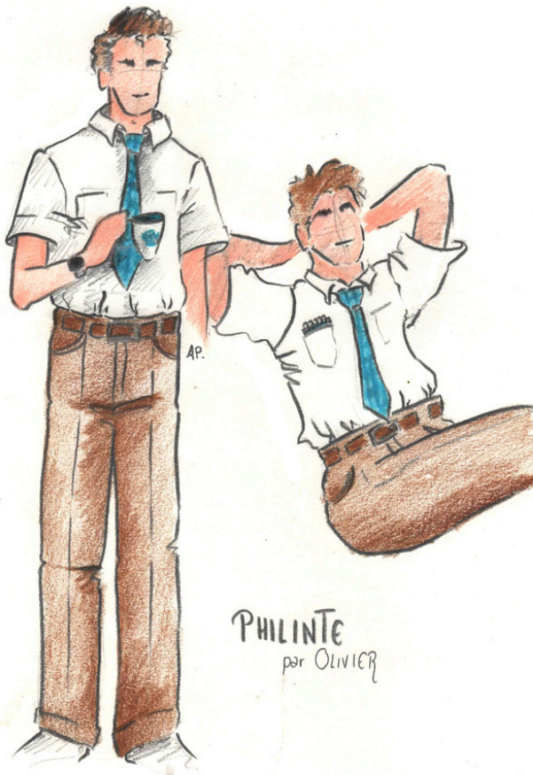
PHILINTE par OLIVIER