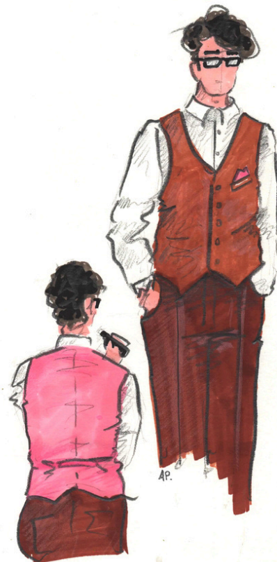
ACASTE par BRYAN