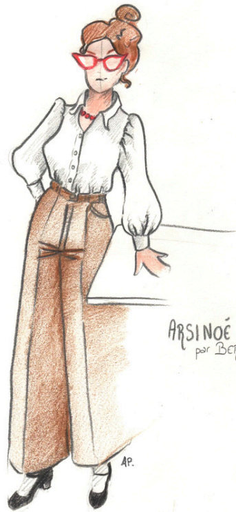
ARSINOË par BERTILLE.