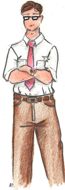
CITANDRE par OLIVIER