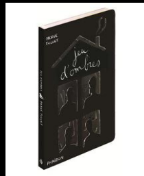
« Jeu d'ombres » d'Hervé Tullet