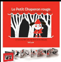
« Le Petit Chaperon rouge » de Clémétine Sourdis