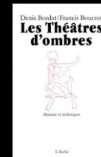
Les théâtres d'ombres Histoire et techniques Denis Bordat/ Francis Boucrot