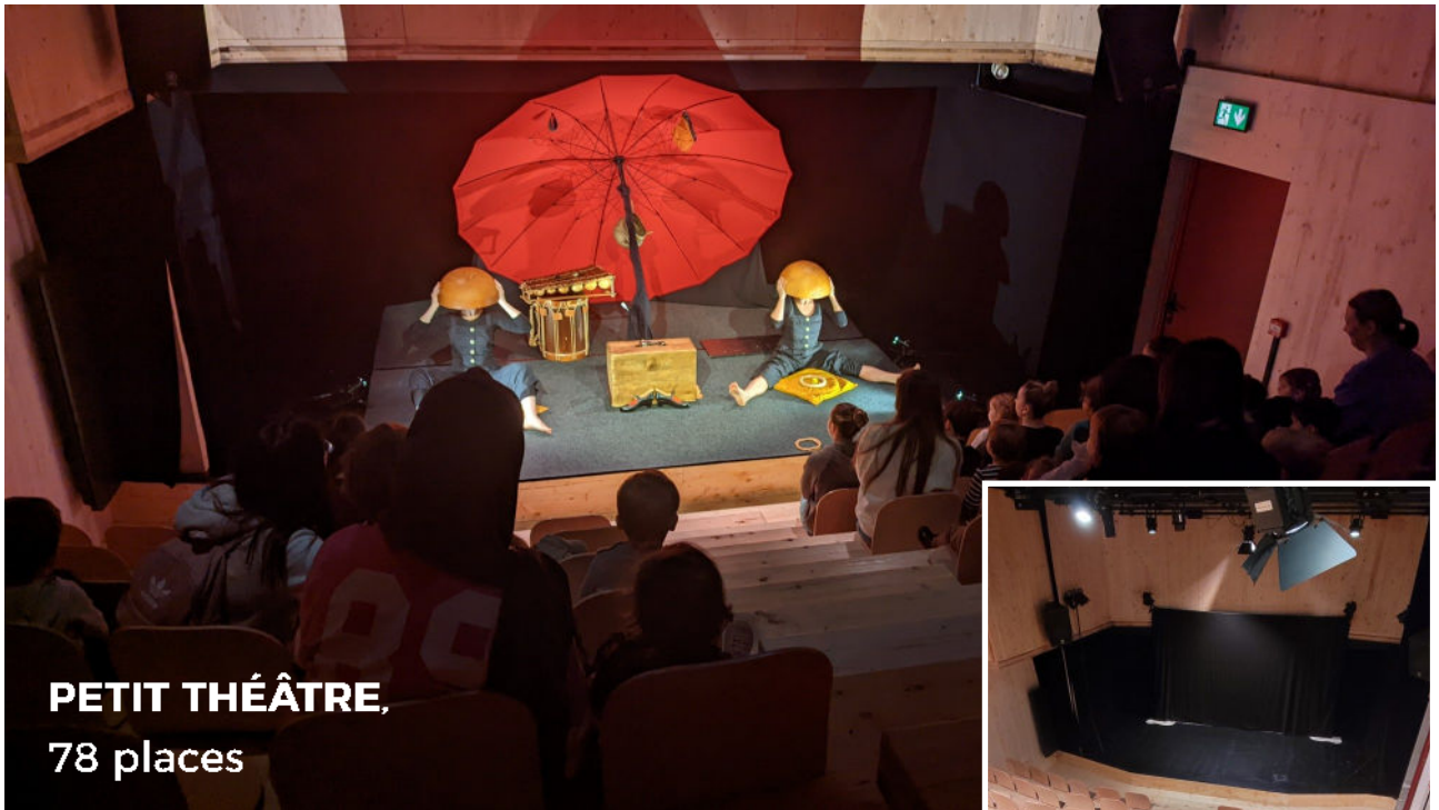
PETIT THÉÂTRE, 78 places