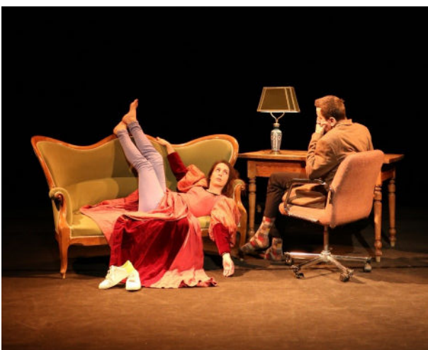
Molière, Shakespeare et moi - Création & Production Patadôme - © photo : M. Faure